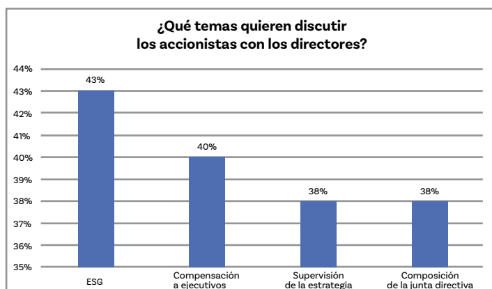
Figura 1 - Fuente: Encuesta Anual de Directores de Empresas 2021 de PwC.

Aunque el cansancio por la pandemia es una respuesta comprensible a un momento difícil, los consejos de administración deben estar atentos no sólo a los retrocesos en materia de gobierno corporativo, sino también a la necesidad de tomar medidas proactivas para avanzar en la calidad en este ámbito. Además, deben considerar hasta qué punto sus empresas se anticipan y responden a las peticiones de los accionistas de una mayor responsabilidad y cambio—especialmente en lo que respecta a las cuestiones ESG. Los consejos de administración pueden recurrir a su función de auditoría interna para obtener un aseguramiento y un asesoramiento valiosos y objetivos sobre la mejor manera de tener éxito en sus esfuerzos por mejorar la calidad del gobierno corporativo.